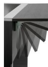
► Z półką do przesuwania tac