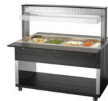
► Wózek bufetowy na ciepłe dania