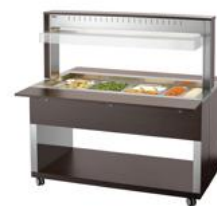
► Wózek bufetowy na ciepłe dania