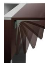
► Z półką do przesuwania tac